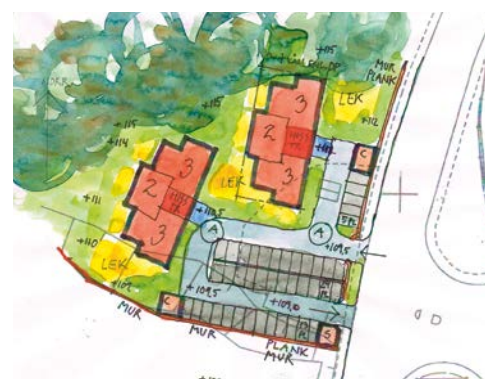
Kvarteret Statsrådet i Mjölby. (Fd Bebbes kiosk.)