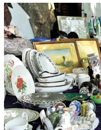
Behöver du mera förrådsutrymme. Prata med Bobutiken. ■

Mer information om lediga lokaler får man i Bobutiken på Burensköldsvägen 6 i Mjölby. ■