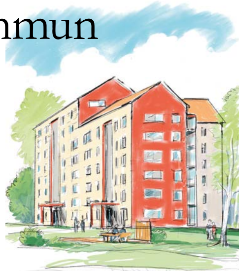
Kvarteret Rosenkammaren i Mjölby. (Vid ICA)

– Hos oss ska det vara tryggt och enkelt att bo, oavsett vem man är. ■