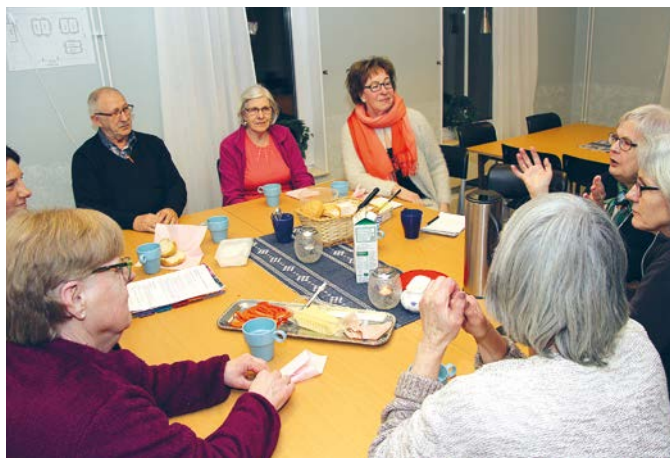
Boinflytandegruppen på Magasinsvägen i Mantorp diskuterar vilka insatser man vill göra för att öka trivselen i bostadsområdet.

ETT ÖKAT BOINFLYTANDE ÄR ETT VIKTIGT MÅL FÖR BOSTADSBOLAGET.